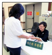
← <예수회 후원회>

매 주일 친교실에서 예수회 후원금을 모금합니다. 교우분의 많은 참여를 부탁드립니다!