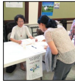
←<1일 침묵 피정>

매 주일 친교실에서 예수회 후원금을 모금합니다. 교우분의 많은 참여를 부탁드립니다!