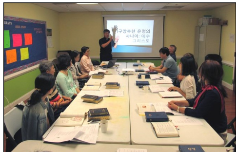
<2019년 부활 영세자 교리반> ↑