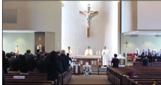
<장례 미사> ↑

10월 6일(토) 오후 12시 故 이광명(실라오) 님의 장례미사가 대성전에서 봉헌되었습니다.