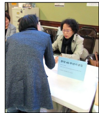
← <40주년 기념집>

매 주일 미사 후 친교실에서 분당 40주년 기념집 구입 (1권당 $10) 신청을 받고 있습니다.