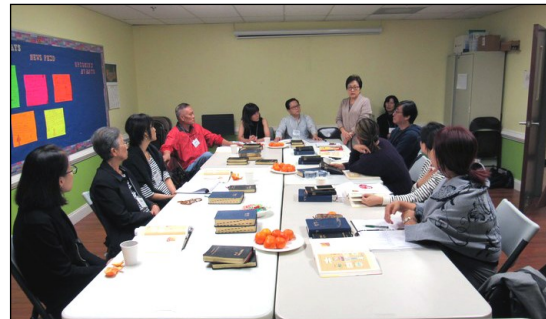
<2019년 부활 영세자 교리반> ↑