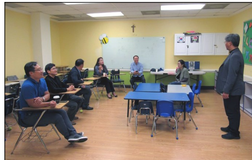
← <빛과 소금>

10월 21일(일) 오후 12시 30분부터 108호실에서 월례모임이 있었습니다.