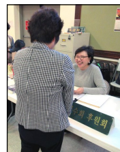
← <예수회 후원회>

11월 10일(토) 오전 9시부터 오후 4시 30분까지 성김대건 성당에서 모든 신자들을 대상으로 하는 1일 피정이 있습니다. 주일 친교실에서 신청을 받고 있습니다.