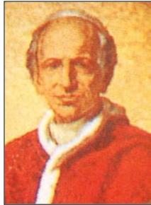
← 교황 레오 13세

교황 비오 11세의 「사십주년」과 함께 가톨릭 사회 회칙의 초석을 놓은 문헌이 바로 교황 레오 13세의 「노동헌장」(Rerum Novarum)이다. 문헌의 첫 머리를 따 「레룸 노바룸」(새로운 사태)이라고 불린 이 회칙은 산업혁명 이후 사회발전에서 자유 방임적인 자본주의와 집단주의적 사회주의가 갖는 문제점들을 함께 지적하면서 복음적 시각에 바탕을 둔 대안을 모색한 혁명적인 문헌이다.