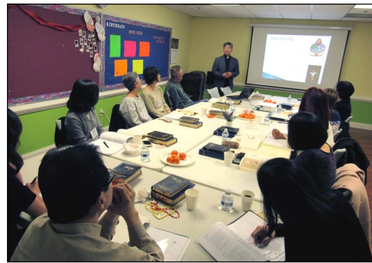
<2019년 부활 영세자 교리반> ↑