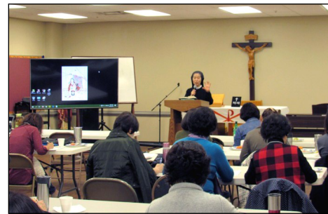
↙ <요한 복음 연수>

매 주일 친교실에서 예수회 후원금을 모금합니다. 교우분의 많은 참여를 부탁드립니다!