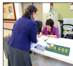
← <예수회 후원회>

11월 10일(토) 오전 9시부터 오후 4시 30분까지 성 김대건 성당에서 모든 신자들을 대상으로 하는 1일 피정이 있습니다. 주일 친교실에서 신청을 받고 있습니다.