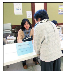
← <40주년 기념집>

매 주일 미사 후 친교실에서 본당 40주년 기념집 구입 (1권당 $10) 신청을 받고 있습니다.