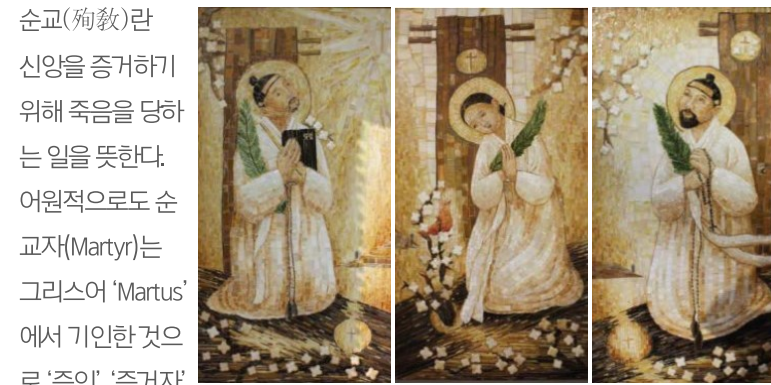
「순교 성인들」 당고개 모자이크 벽화

순교(殉敎)란 신앙을 증거하기 위해 죽음을 당하는 일을 뜻한다. 어원적으로도 순교자(Martyr)는 그리스어 'Martyr'에서 기인한 것으로 '증인', '증거자'의 의미를 지닌다. 참된 그리스도인의 순교는 스승이신 그리스도의 삶과 온전히 일치하고 그분의 삶을 본받는 것이며, 그리스도의 증거와 구원사업에 완전히 참여하는 것이다. 그 결과 세상 사람들에게 그리스도의 복음을 증거하게 된다.