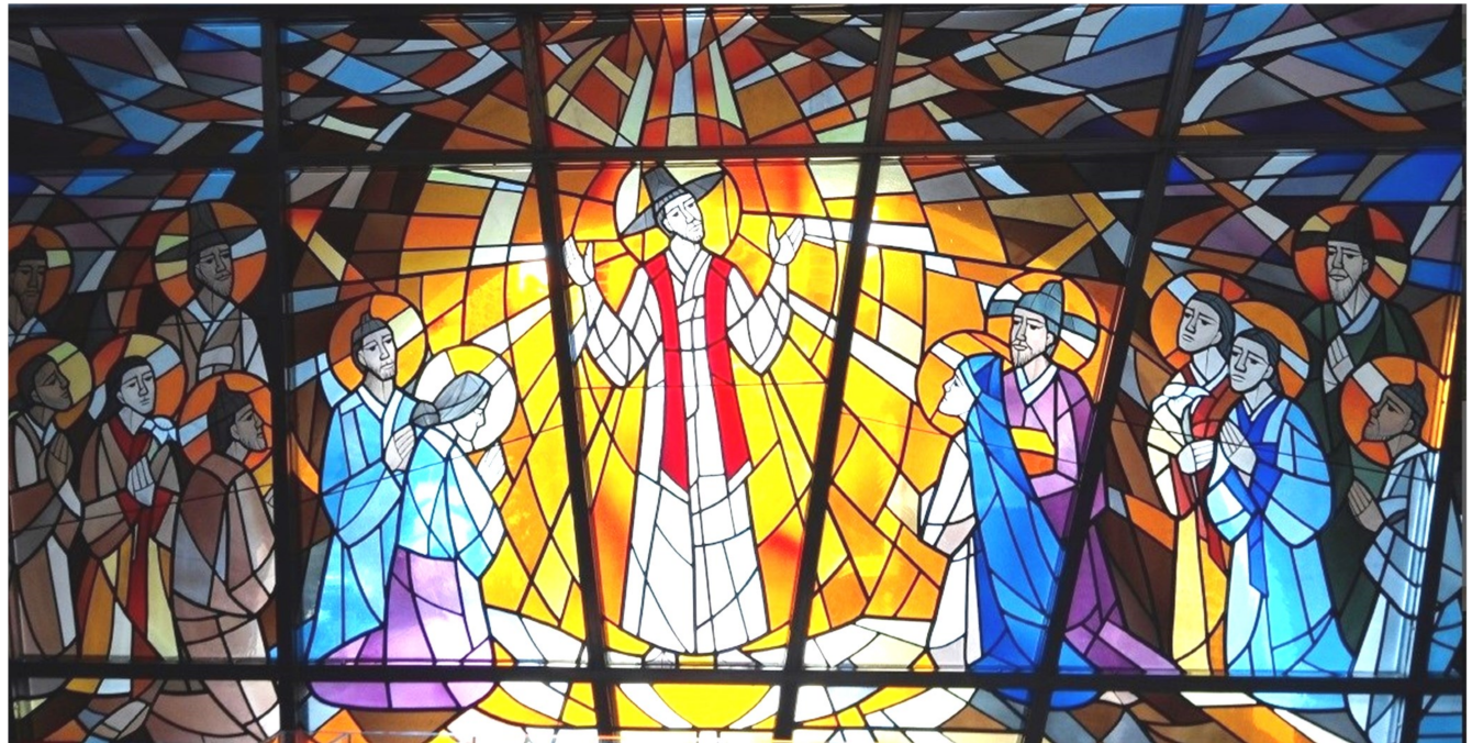
〈성 김대건 안드레아 신부와 한국 순교자들〉, 서울대학교 한강 성당 유리화

“너희는 주의하여라. 모든 탐욕을 경계하여라. 아무리 부유하더라도 사람의 생명은 그의 재산에 달려 있지 않다.” (루카 12,15)