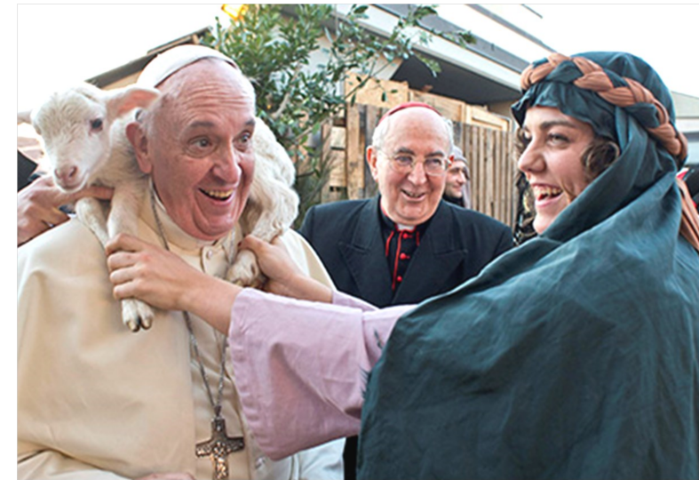
▲ 양을 어깨에 짊어진 프란치스코 교황이 환한 웃음을 짓고 있다. 로마 인근 성당을 방문한 교황이 어린 양을 목에 두른 모습.

목자는 자신이잃은양이 어떤양인지를 알고 양을 찾으러 나섰을 것이다. 요한 복음서의 말씀(요한 10,3-4)처럼 당대의 관습상 목자는 양 한 마리 한 마리에게 이름을 붙여 주고, 각각의 양을 다 알아볼 수 있었기에, 또 양들 역시 목자의 목소리를 알아