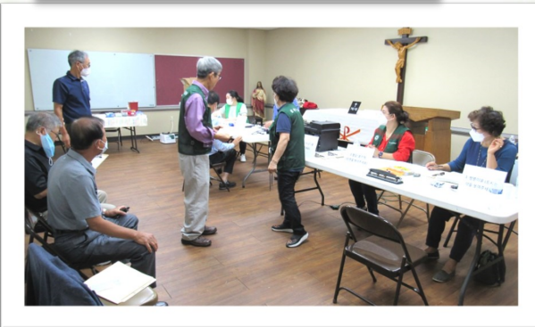
9월 4일 (일) 성 루가 의료 봉사회 진료

오후 12시 30분부터 소성당에서 진료가 있었습니다. 진료를 원하시는 분들은 복용중인 약병을 지참해주시면 진료에 도움이 됩니다.