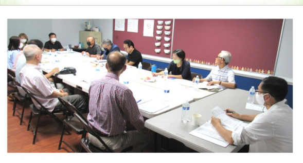
9월 4일 (일) 구역장 회의