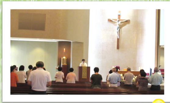
9월 3일 (토) 성모 신심 미사