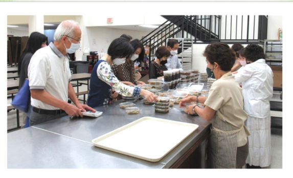
9월 4일 (일) 성모회 반찬 판매