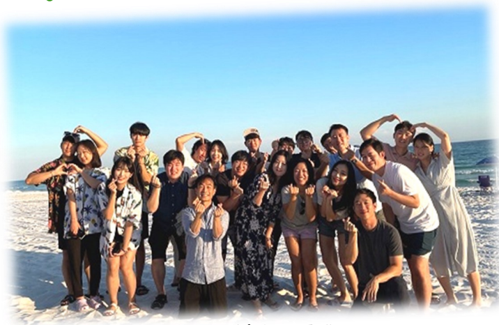
9월 23~25일 청년회 여름캠프 청년회에서 2박 3일 일정으로 보좌신부님과 함께 테스트로 여름캠프를 다녀왔습니다.