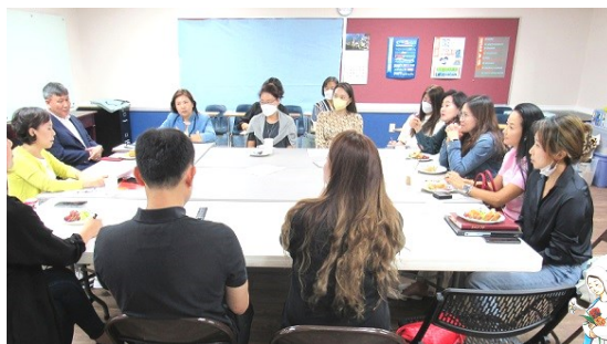
9월 25일 (일) 복사단 학부모 회의