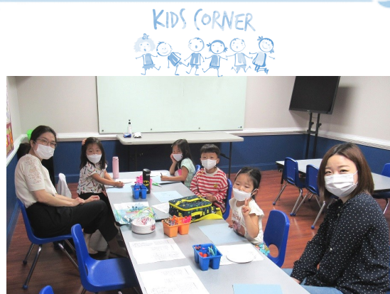
9월 25일 (일) 주일학교