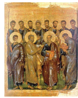
<예수님의 제자들>, 14세기

봉사자들을 위한 성서 영성 독서회 • 내용: 요한 복음 산책 5권~7권 • 일시: 매주 목요일 6:00pm - 7:00pm • 장소: 소성당 • 문의: 이혁륜 404-518-7373 임혜수 404-246-8142