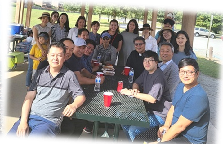
9월 25일 (일) 빛과 소금 Bbq 파티 Chattahoochee Park 에서 바베큐 파티와 게임을 하며 즐거운 시간을 보냈습니다.