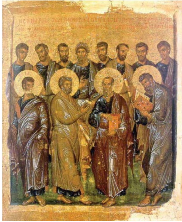
<예수님의 제자들>, 14세기, 템페라, 푸시킨 미술관, 모스크바, 러시아

사도들이 주님께, “저희에게 믿음을 더하여 주십시오.” 하고 말하였다. 그러자 주님께서 이르셨다. “너희가 겨자씨 한 알만 한 믿음이라도 있으면, 이 돌무화과나무더러 ‘뽕혀서 바다에 심겨라.’ 하더라도, 그것이 너희에게 복종할 것이다. (루카 17,5-6)