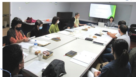
9월 25일 (일) 성인 예비자 교리반 수업