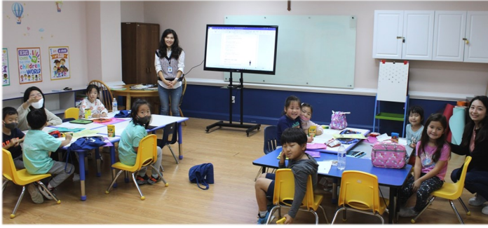
10월 16일 (일) 주일학교