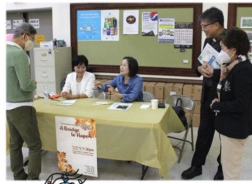
가을 음악회 티켓 판매 11월 5일 토요일 오후 7:30에 가을 음악회가 열립니다. 많은 관심과 참석을 부탁드립니다.