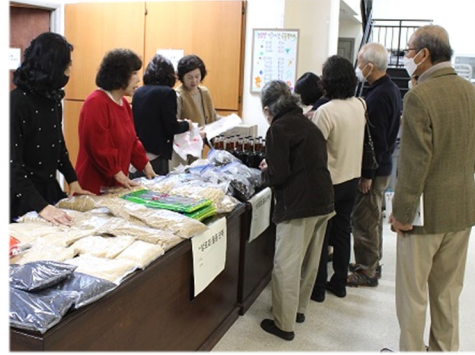
10월 16일 (일) 성모회 물품판매