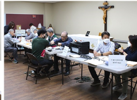
10월 16일 (일) 성 루가 의료 봉사회 진료 모습 내과, 치과, 비뇨기과, 한방과 진료를 보실 수 있습니다.