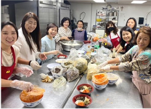
10월 16일 (일) 주일학교 PTA 기금마련 음식 판매 음식 준비를 위해서 수고해주신 학부모님들께 감사드립니다.