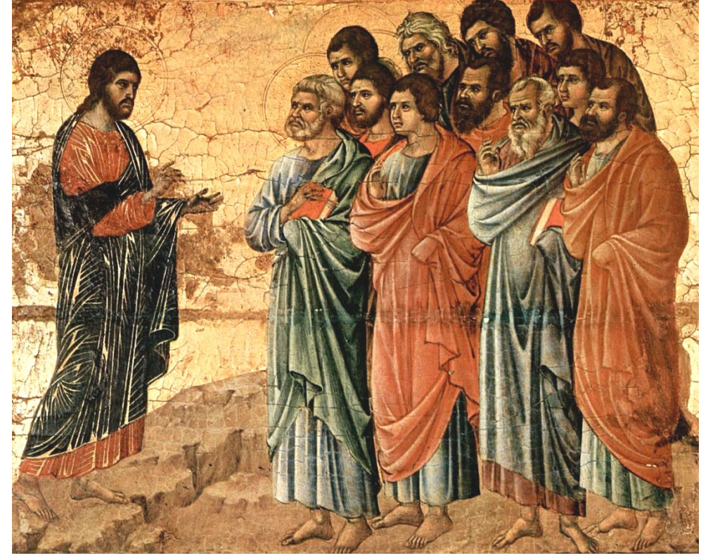
<갈릴래아 산에 나타남>, 1308-1311년, 두치오

내가 너희에게 명령한 모든 것을 가르쳐 지키게 하여라. 보라, 내가 세상 끝 날까지 언제나 너희와 함께 있겠다. (마태오 28, 20)