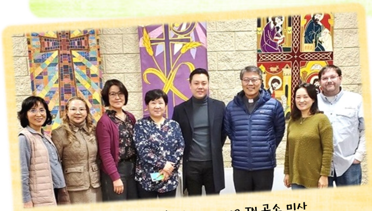
11월 13일 (일) Chattanooga TN 공소 미사

예비자들과 교리반 봉사자들이 Conyers에 위치한 트라피스트 수도회(Monastery of The Holy Spirit)를 방문해서 수사님들의 삶을 통해 하느님께 더 가깝게 다가가는 시간을 가졌습니다.