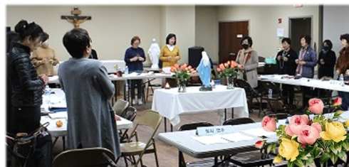
11월 13일 (일) 꾸리아 월례 모임