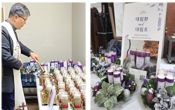
11월 13일 (일) 복사단 피정 금마련을 위한 복사단 PTA 대림환, 대림초 판매