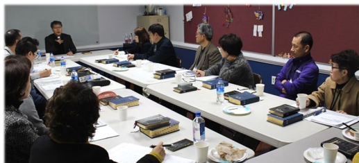
11월 13일 (일) 예비자 교리반 수업