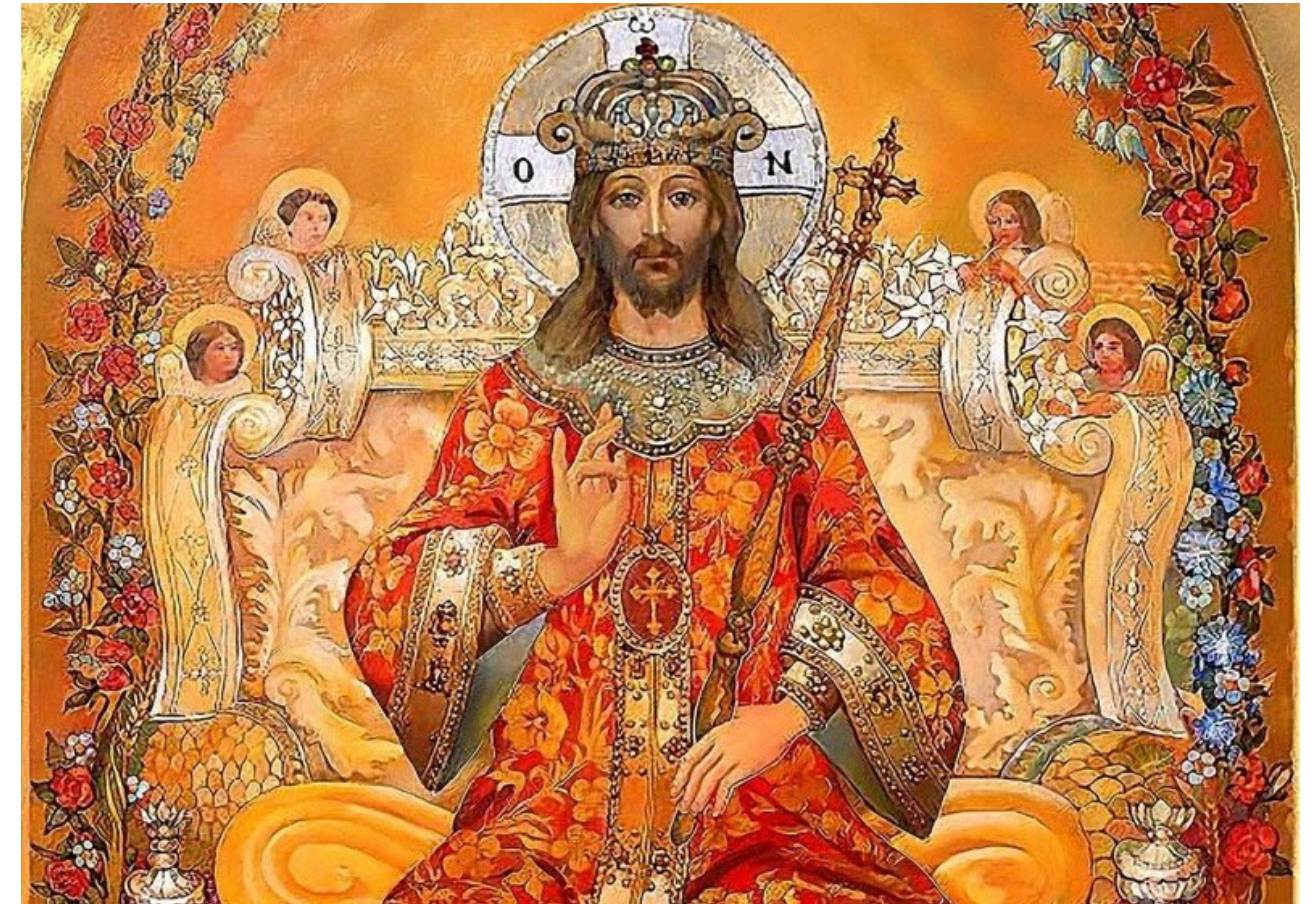
《Jesus Christ the Returning King》, Janusz Antosz