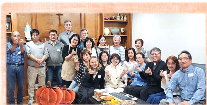
11월 11일 (금) Marietta 사랑 구역미사