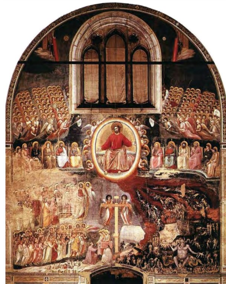
지오토(Giotto di Bondone, 1267-1337), 최후의 심판, 프레스코이탈리아 파도바 스크로베나 성당 소장.

우리는 전례력으로 마지막 주일을 마무리하며 그리스도의 사랑을 실천하며 깨어 사는 하느님의 자녀로 거듭날 것을 깊이 다짐해야겠다.