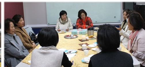
11월 13일 (일) 성서 봉사자 회의