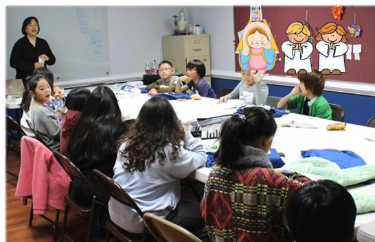
11월 13일 (일) 주일학교