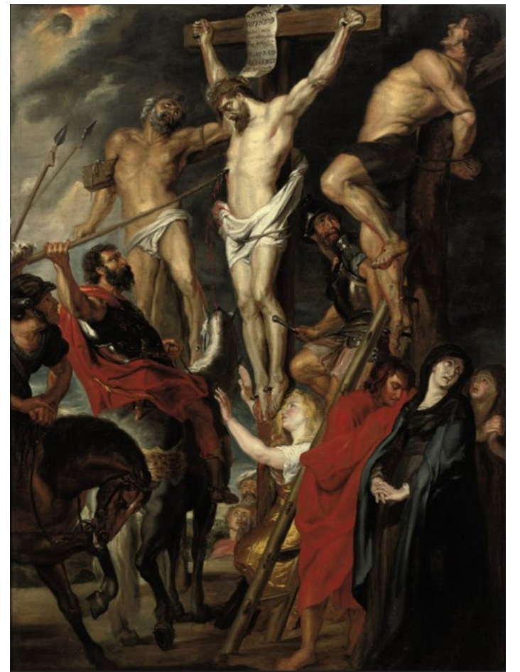
<두 강도 사이에 있는 십자가의 그리스도>, Peter Paul Rubens, 1577~1640

이제 아랫부분을 보겠습니다. 여기에는 세 부류의 인간이 있습니다. 예수님께서 이미 숨지신 것을 확인하고 그분의 옆구리에 창을 찌르는 군인과 처형자들이 한 부류입니다. 그리고 그분의 죽음을 보고 깊은 슬픔에 잠겨 애도하는 어머니와 추종자들이 다른 한 부류입니다. 또 그분의 죽음을 호기심으로 바라보는 터번을 쓴 지도자와 구경꾼이 마지막 한 부류입니다. 구경꾼들은 십자가 밑에서 예수님의 죽음을 바라봅니다. 그리고 지도자들은 예수님께 말했습니다. “이자가 다른 이들을 구원하였으니, 정말 하느님의 메시아, 선택된 이