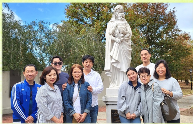
11월 5일 (토) 예비자와 봉사자들 수도원 방문

예비자들과 교리반 봉사자들이 Conyers에 위치한 트라피스트 수도회(Monastery of The Holy Spirit)를 방문해서 수사님들의 삶을 통해 하느님께 더 가깝게 다가가는 시간을 가졌습니다.