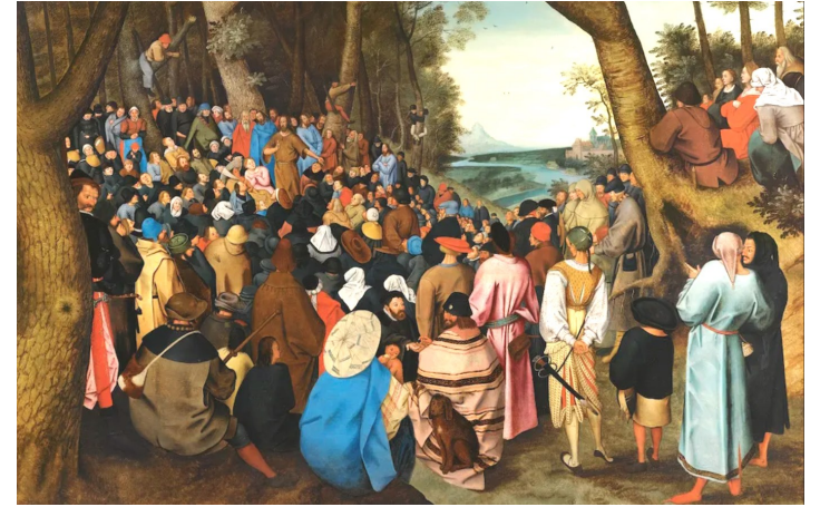
▲<세례자 요한의 설교>, 피터 브뤼겔 ▼부분

남녀노소 가릴 것 없이 수많은 군중이 높은 언덕배기 주위에 몰려들어 세례자 요한의 설교에 귀를 기울이고 있다. 군중들 중에는 칼을 찬 군인도 있고, 수도복을 입은 수도자들도 있으며, 세금을 징수하는 세관원도 있고, 지팡이를 들고 가방을 메고 여행 복장을 한 순례자도 있다. 화려한 옷을 입은 여자도 있고, 시녀의 옷을 입은 하인도 있으며, 좋은 옷을 입은 귀족도 있지만 대부분 사람은 평민의 옷을 입은 농민들이다. 아이들은 나무에 올라 요한의 설교를 들으려한다. 군중들의 시선은 중앙에 있는 세례자 요한에게로 집중되고 있는데, 광야에서 살았던 요한은 엉클어진 긴 머리에 낙타털로 된 자루 옷을 걸치고 두 팔을 활짝 펴고 설교를 하고 있다. 군중은 어리석고 순진한 표정으로 몰입하여 경청하고 있는데, 전경에 있는 몇몇 사람들은 이