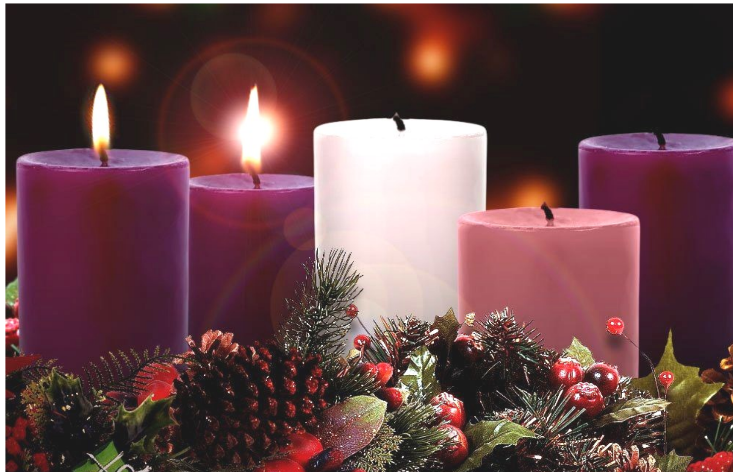
<대림 제2주일, 대림초>