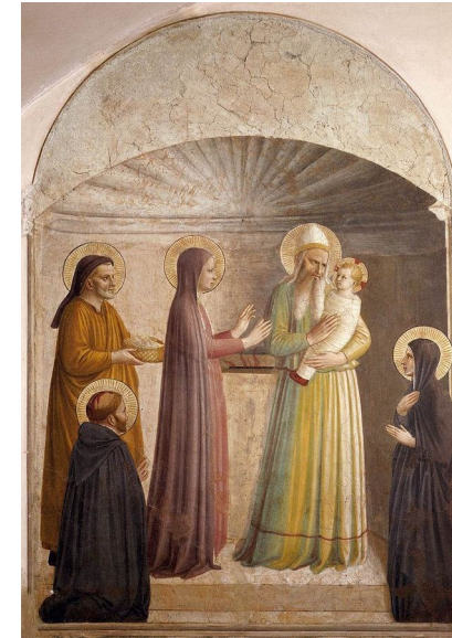
Presentation of Jesus in the Temple, by Fra Angelico, 1440-42

아기 예수께서 하느님 아버지의 성전에 처음으로 들어가고 그 안에서 시메온과 한나를 만난 사건을 기념해 ‘만남의 축일’이라 부르며 촛불 행렬을 했다. 예수께서 “계시의 빛”이라고 한 시메온의 찬미를 드러내기 위해 촛불을 밝힌 것이다. 이 예식이 5세기 중엽 로마 교회에도 알려지기 시작해 서방 교회에 전파됐다. 서방 교회에서는 동방 교회처럼 ‘만남의 축제일’ 또는 ‘성 시메온의 날’로 지냈다. 중세 후반에는 촛불 행렬 때문에 ‘성축절(聖燭節)’이라 불리기도 했다. 이후 성모 신심과 성모 축일이 발달하면서 1969년까지 ‘성모 취결례(取潔禮)’로 지냈다. 오랫동안 주님 축일을 성모 축일로 지내온 것이다. 제2차 바티칸 공의회 전례 개혁으로 이 축일의 본뜻을 되찾아 1970년부터 ‘주님 봉헌 축일’로 지내고 있다.