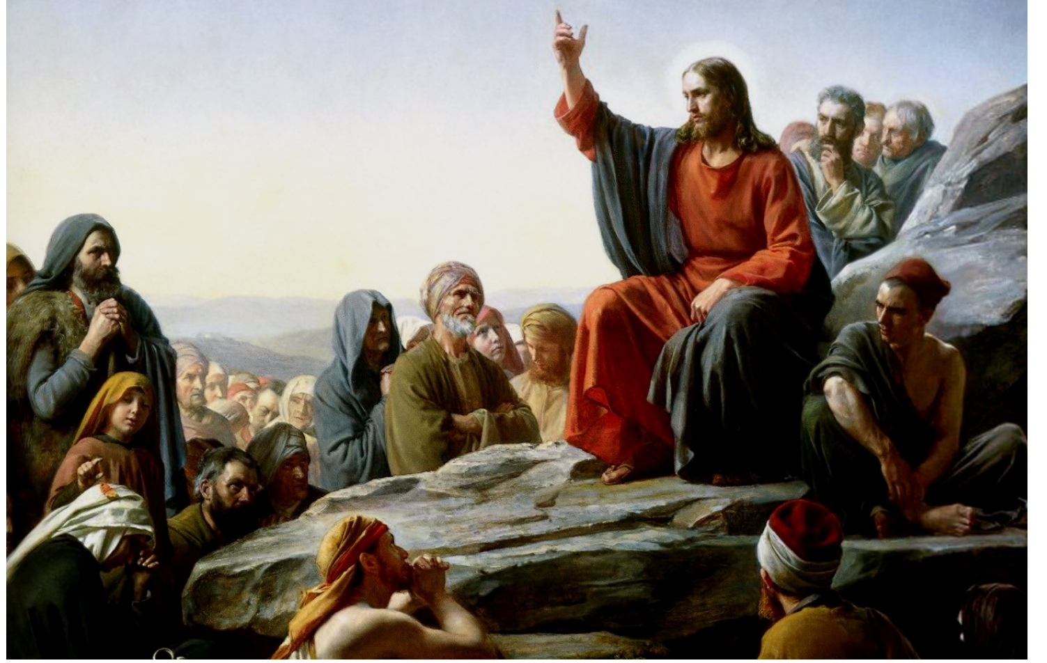
<비유로 가르치시는 예수님>, 칼 하인리히 블로흐, 1879년, 덴마크 국립역사박물관 소장