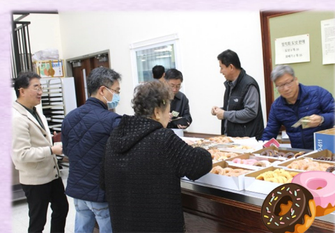
2월 19일 (일) 망치회 도넛 판매 주일 친교실에서 도넛 판매가 있었습니다.