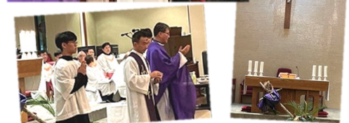
2월 22일 (수) 재의 수요일 미사 오후 7시 30분에 재의 수요일 미사가 있었습니다.