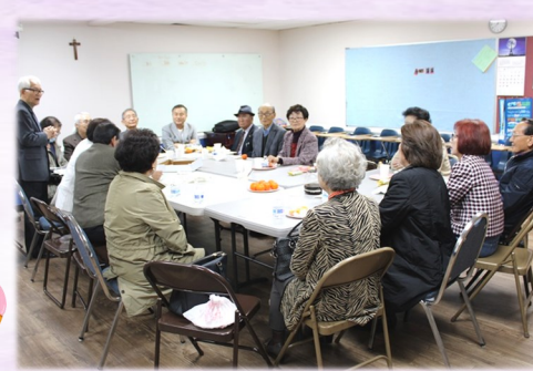
2월 19일 (일) Marietta 자비 구역 모임 대건 도서관에서 모임이 있었습니다.