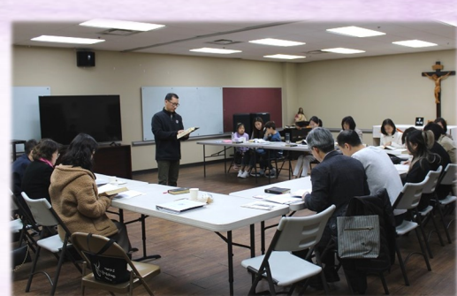
2월 19일 (일) 예비자 교리반 소성당에서 예비신자 교리반 수업이 있었습니다.