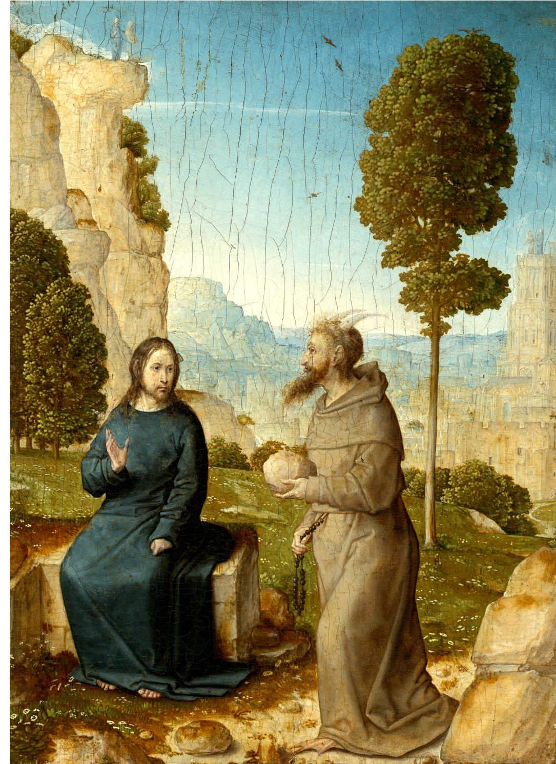
〈악마의 유혹〉 후앙 데 플라데스, 목판에 유채, 미국 워싱턴 국립미술관