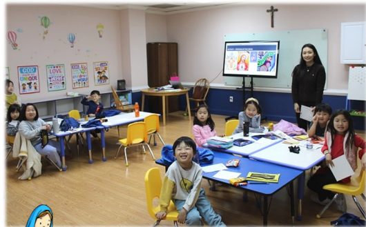
2월 26일 (일) 주일학교