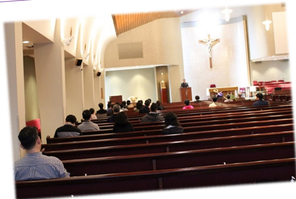
2월 25일 (토) 전례 봉사자 교육 전례 봉사자 교육이 대성전에서 있었습니다.