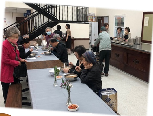
2월 26일 (일) 꾸리아 점심판매 꾸리아에서 미사 후 점심 판매가 있었습니다.

이는 내가 사랑하는 아들, 내 마음에 드는 아들이니, 너희는 그의 말을 들어라.