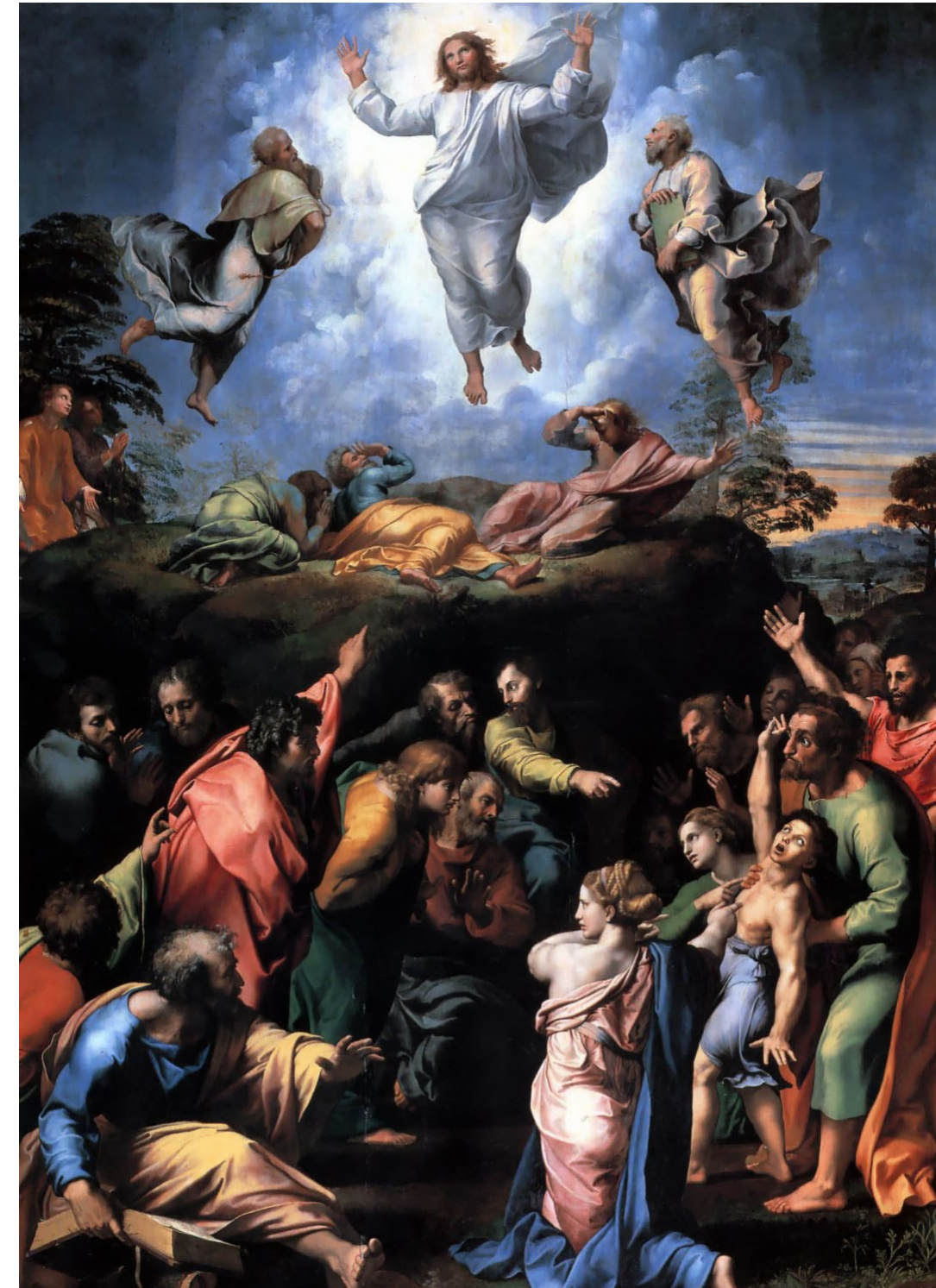
<주님의 거룩한 변모>, 라파엘로(1516-1520), 바티칸 박물관