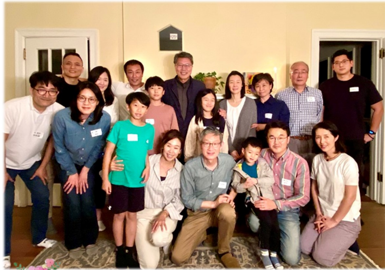
2월 24일 (금) In Town 구역 미사