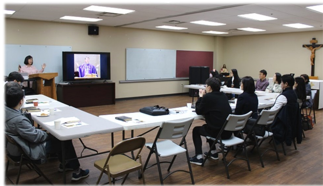
2월 26일 (일) 견진 교리반 소성당에서 성인 견진 교리반 수업이 있었습니다.