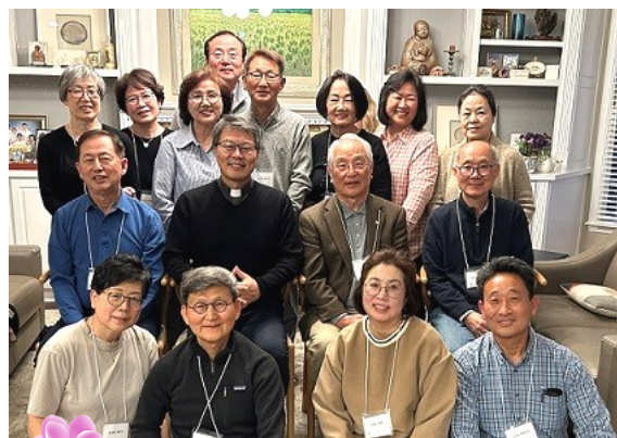
3월 17일 (금) Forsyth 구역미사