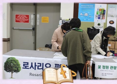
3월 19일 (일) 로사리아 평생 대학 접수