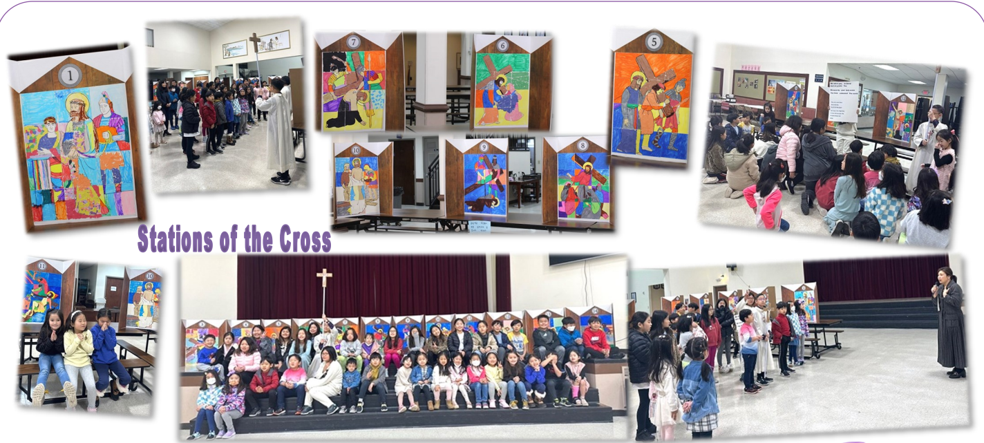
Stations of the Cross