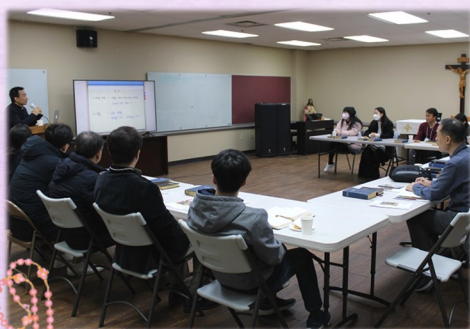
3월 19일 (일) 견진 교리반 수업