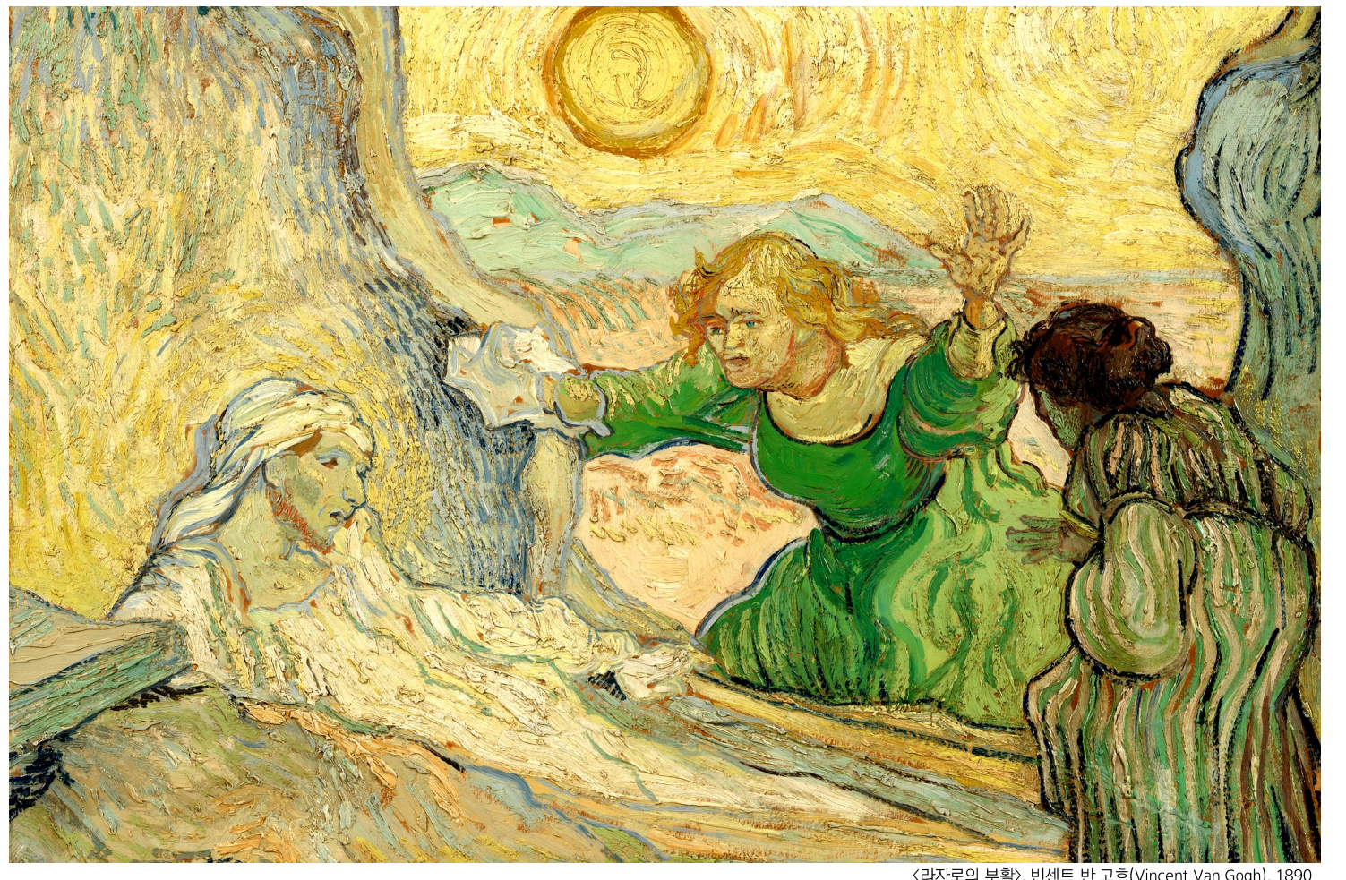
<라자로의 부활>, 빈센트 반 고흐(Vincent Van Gogh), 1890