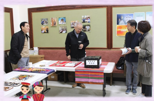
3월 19일 (일) 페루 선교 후원금 Donation