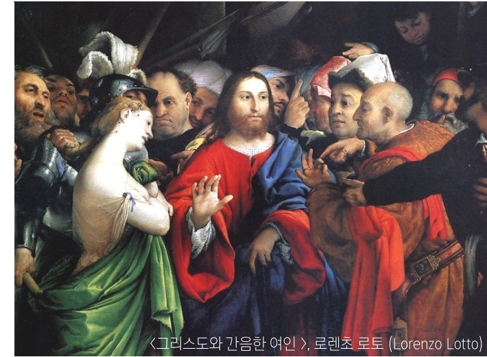
〈그리스도와 간음한 여인〉, 로렌초 로토 (Lorenzo Lotto)

“너희 가운데 죄 없는 자가 먼저 저 여자에게 돌을 던져라.” (요한 8,7)