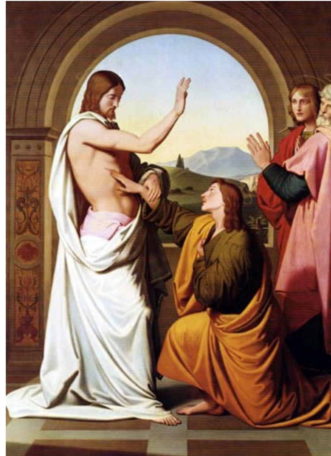
〈의심하는 토마스〉, 요한 프리드리히 오버벡(Johann Friedrich Overbeck), 1851년