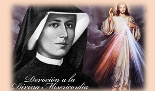
Devoción a la Divina Misericordia

예수님, 주님은 숨을 거두셨으나 영혼들을 위하여 생명의 원천은 세차게 흘러 나왔으며 자비의 바다는 온 세상을 위해 열렸습니다. 오, 헤아릴 길 없는 하느님 자비이신 생명의 샘이시여, 주님께서는 온 세상을 감싸시면서 저희에게 당신 자신을 온전히 비우셨나이다. 저희를 위한 자비의 샘이신 예수님의 성심에서 세차게 흘러나온 오 거룩한 피와 물이시여, 저는 당신께 의탁합니다! 아멘.