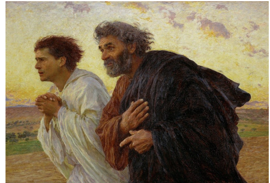
<무덤으로 달려가는 사도 베드로와 요한>, 외젠 뷔르낭(Eugene Bumand)

부활의 현장을 확인하기 위해서 아침에 무덤으로 달려가는 사도 베드로와 요한을 보고 있으면 우리들도 그들과 갈릴래아 들판을 달려가고 있는 듯한 생각을 갖게 된다. 부활하신 주님께서도 오늘도 어둠에 사로잡혀 있는 모든 사람들의 구원을 위해서 먼동이 터오듯이 우리에게 다가오신다.