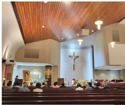
자비 주일 예식 4월 16일 (일) 대성전에서 자비 주일 예식이 있었습니다.