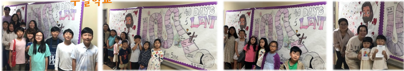
주일학교 친구들이 사순 기간동안 열심히 한 개수 만큼 붙인 하트 스티커를 들고 사진을 찍었어요.