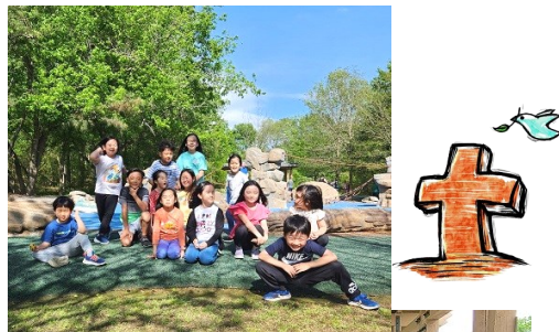
빛과 소금 4월 모임