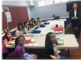
4월 16일 (일) 주일학교 수업모습