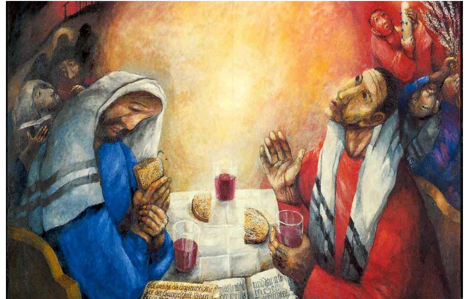
<엠마오의 저녁 식사>, 지거 쿼더(Sieger Köder), 1851년