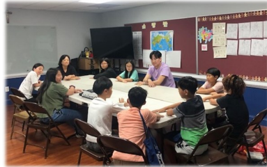
<첫 영성체반 학부모 기도 모임>