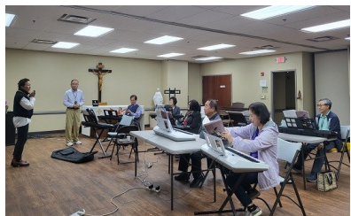
로사리오 평생대학 수업모습