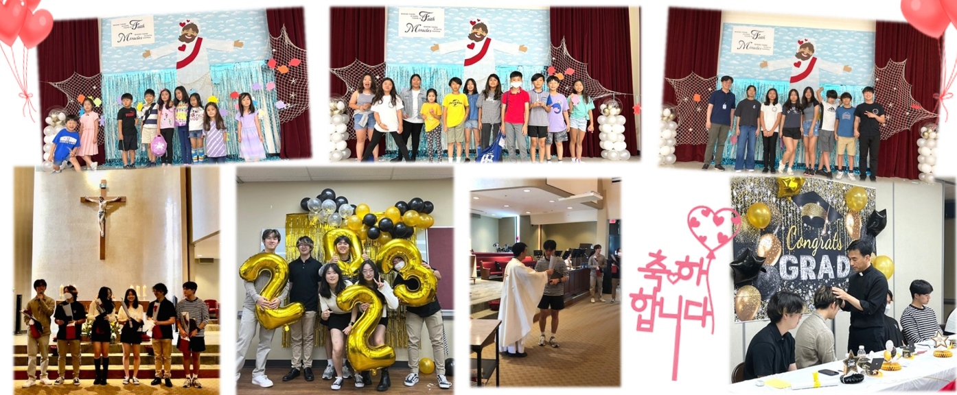
Youth Group 학생들이 졸업식이 있었습니다. 주일학교 시간에는 보좌신부님께서 안수해주시고, 영어미사 중에는 졸업장과 선물, 꽃다발 증정식이 있었습니다. 수고한 학생들과 학부모님들을 위해 많은 기도 부탁드립니다.

초, 중, 고 아이들이 예수님께 드리고 싶은 기도를 적어서 봉헌하는 Prayer Wall을 만들었습니다.