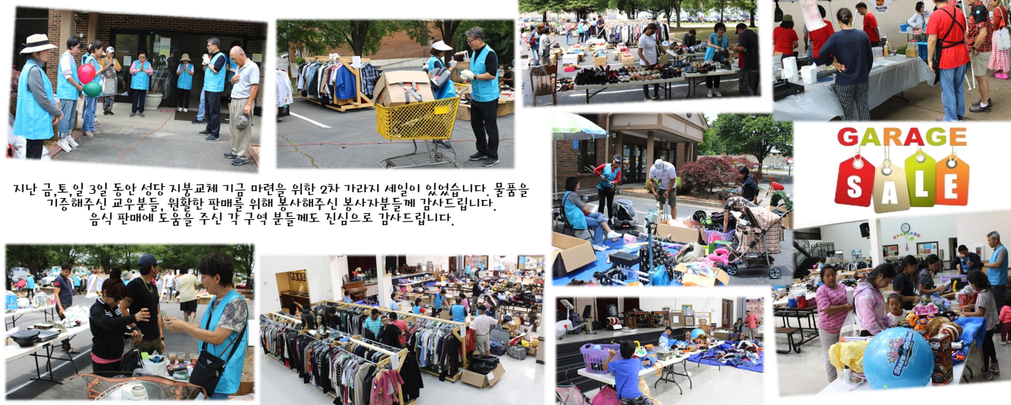
지난 금 토 일 3일 동안 성당 기부교제 기금 마련을 위한 2차 가라지 세일이 있었습니다. 물품을 기증해주신 교우분들, 원활한 판매를 위해 봉사해주신 봉사자분들께 감사드립니다. 음식 판매에 도움을 주신 각 구역 분들에게도 진심으로 감사드립니다.