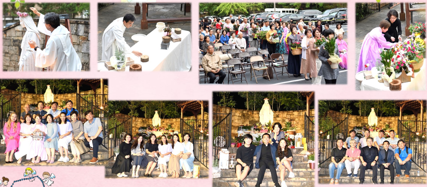
5월 17일 (수) 저녁 미사 후에 성모 동산에서 성모의 밤 행사가 있었습니다.

초, 중, 고 아이들이 예수님께 드리고 싶은 기도를 적어서 봉헌하는 Prayer Wall을 만들었습니다.