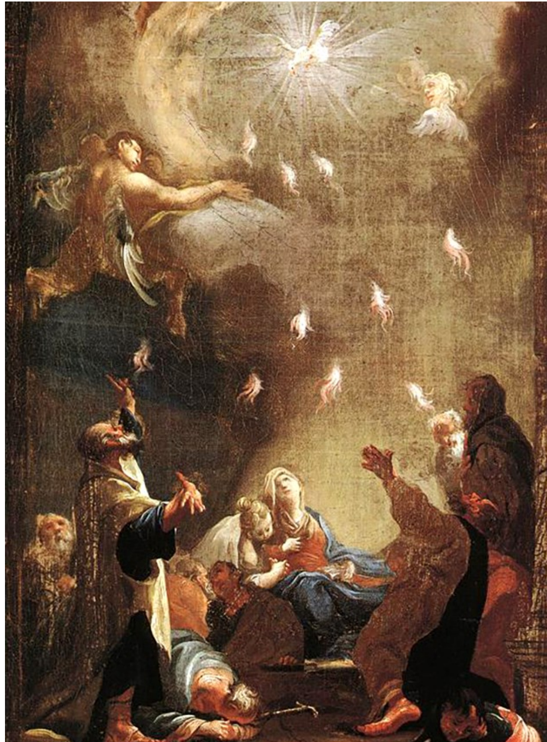
〈성령 강림〉 조셉 이그나즈 밀도퍼, 1782, 캔버스 위 유화, 55 x 33 cm, Hungarian National Gallery, Budapest