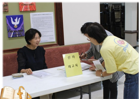
신자 재교육 접수