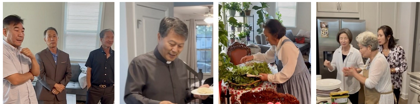
South Atlanta 구역미사