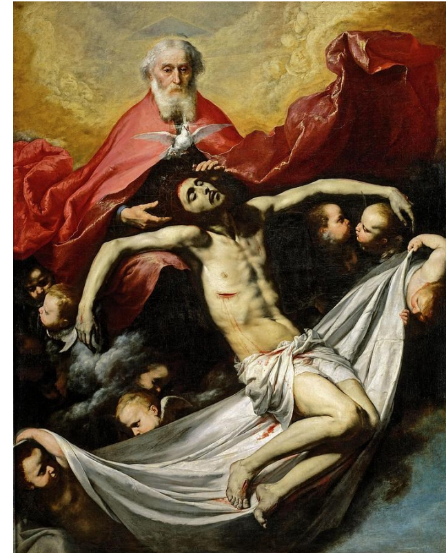
〈삼위일체〉 호세 데 리베라