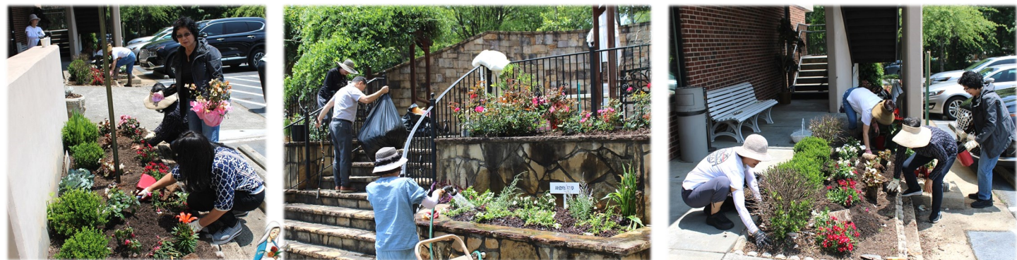
5월 26일 (금) 레지오 마리에 본당 화단 정리