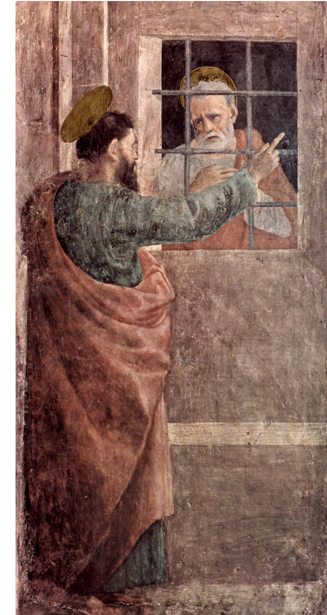
<감옥에 갇힌 성 베드로를 방문한 성 바오로> 필리피노 리피, 1481-82