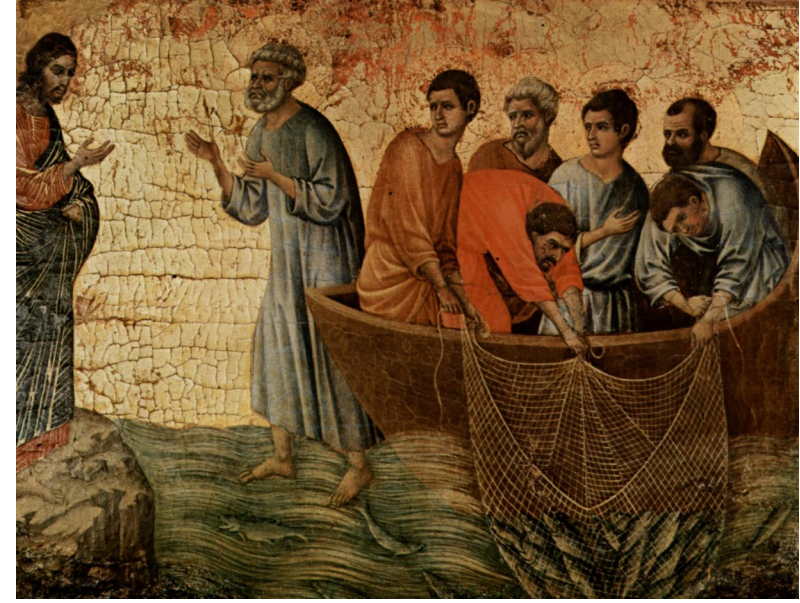
<티베리아스 호숫가에 나타나신 예수님> 두초 디부오닌세나

중세 이탈리아 화단의 거장인 두초(Duccio di Buoninsegna, 1255-1319)는 1308-11년에 시에나대성당을 장식하기 위해 최고의 걸작 <마에스타>를 그렸다. <마에스타 Maesta>는 양면으로 그려졌는데, 전면에는 시에나의 주보성인들과 사도들과 천사들에게 둘러싸인 옥좌에 앉아 있는 성모님이 있고, 아래쪽