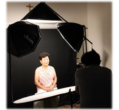
천사 사진반 ‘시니어’ 무료 사진 촬영

301호에서 매주 주일 미사 후 본당 시니어분들을 대상으로 무료 사진 촬영이 있습니다.