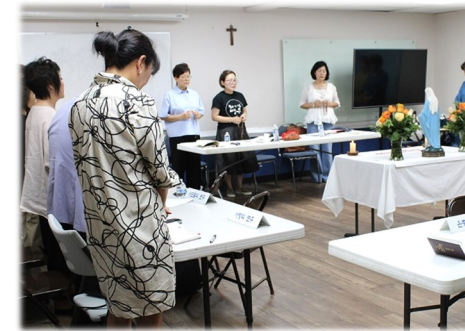
꾸리아 월례 모임

301호에서 매주 주일 미사 후 본당 시니어분들을 대상으로 무료 사진 촬영이 있습니다.