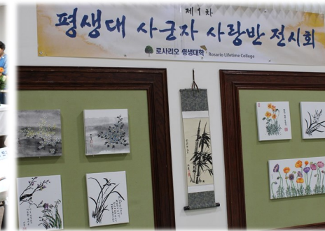
로스리아 평생대학 사군자 사랑반 전시회