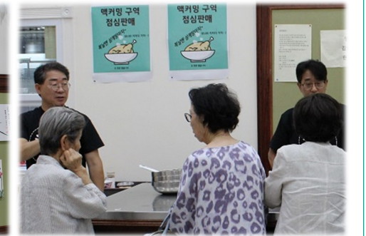
McCumming 구역 점심판매