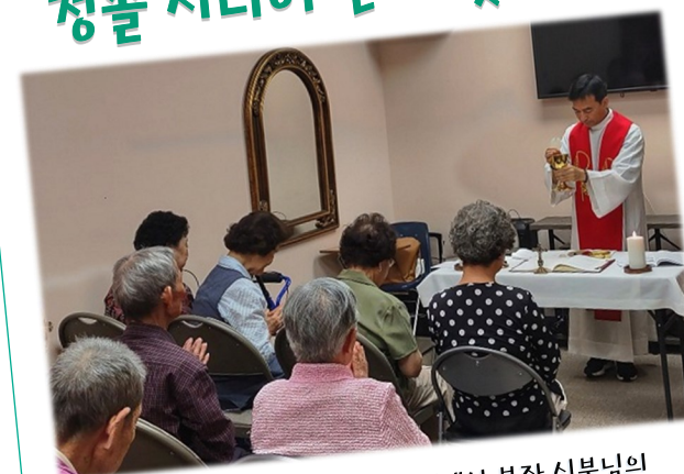
7월 5일 (수) 청솔 시니어 센터에서 보좌 신부님의 집전으로 첫 미사가 있었습니다.