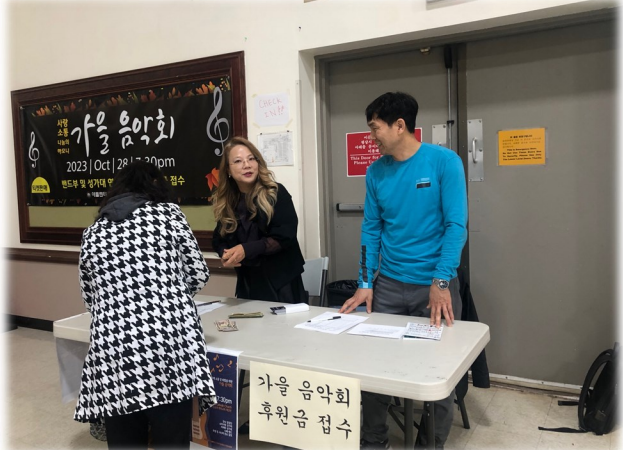
가을 음악회 후원금 접수 및 티켓 판매