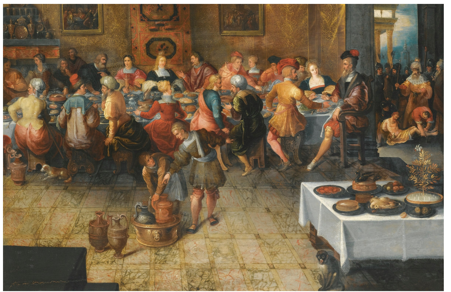
〈혼인 잔치의 비유〉 프란스 크랑켄 2세(Frans Francken II, 1581-1642), 나무판에 유채, 69x88.6cm, 개인소장