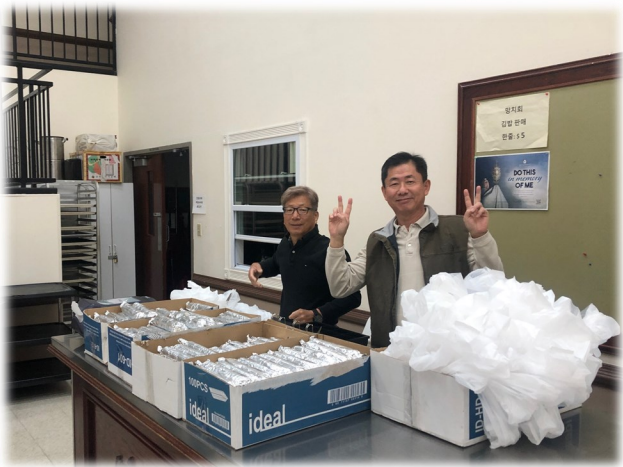
망치회 김밥 판매