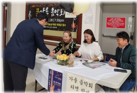
가을음악회 티켓 판매