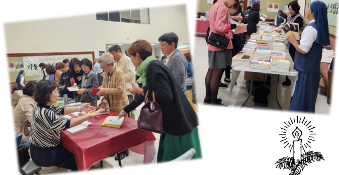
바오로딸 수녀님들 신앙 서적 판매