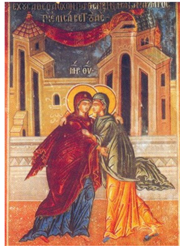
성모 마리아의 엘리사벳 방문. 그리스 이콘

이 실현되고, 구원의 새 시대가 시작됩니다. “은총이 가득한 이여, 기뻐하여라. 주님께서 너와 함께 계시다.”(루카 1,28) 이 말씀은 예수님 탄생의 의미가 무엇인지를 밝혀 주는 것이고, 동시에 마리아의 미래와 믿는 이들의 미래가 어떠할지 알려줍니다. 예수님은 ‘우리와 함께하시는’(Immanu) ‘하느님’(Ei)이십니다. 인간과 함께하시겠다는 하느님의 약속은 구약에서도 하느님의 사명을 부여받은 이들에게 내려주신 말씀입니다.(판관 6,12; 1역대 22,11,16 참조) 마리아