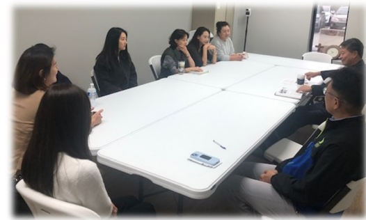
10월 15일 (일) 학부모 대상 영성강의