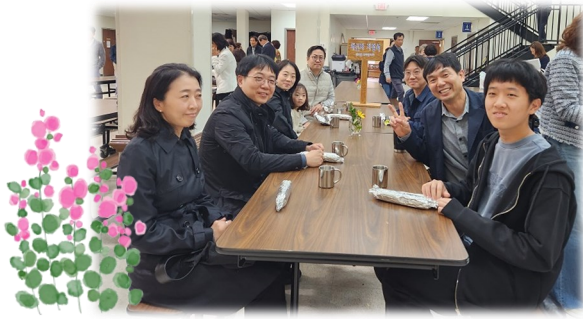
10월 15일 (일) 새신자 식사