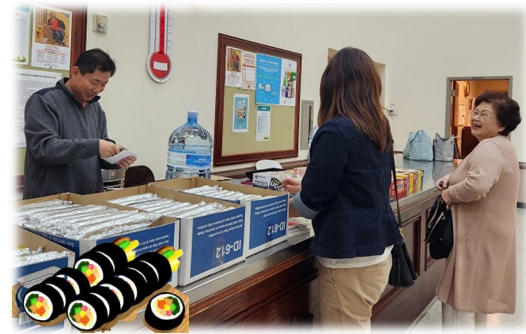
망치회 김밥 판매