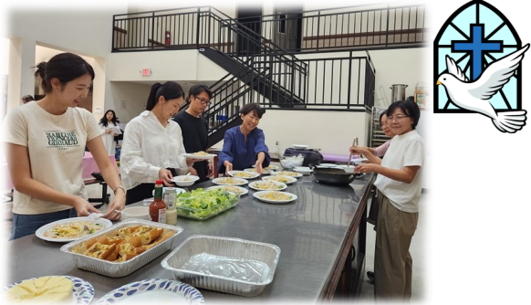
10월 14일 (토) 청년미사후 식사