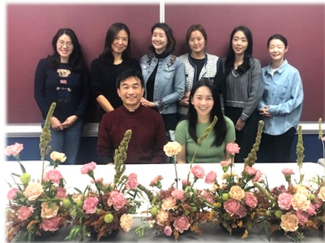
학부모 프로그램 모하기 꽃꽂이반 마지막 수업