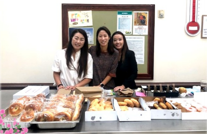
주일학교 PTA 점심 판매