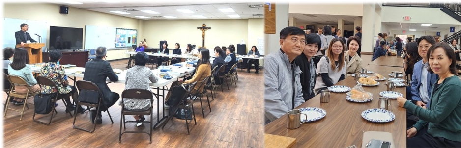
10월 22일 (일) 예비신자 교육 & 식사