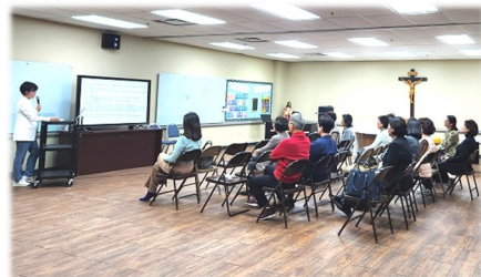
10월 22일 (일) 신자 재교육