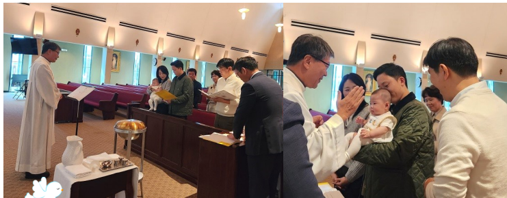
10월 21 (토) 유아 세례