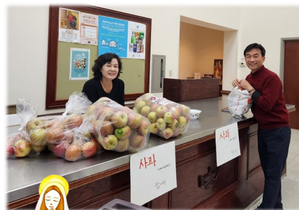
성모회 사과 판매