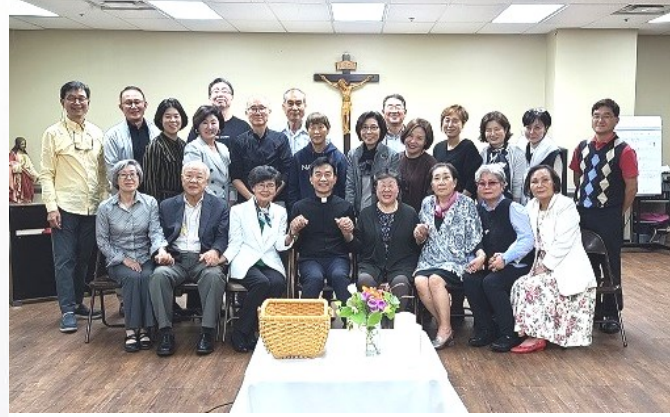
이스라엘 성지 순례팀 회합