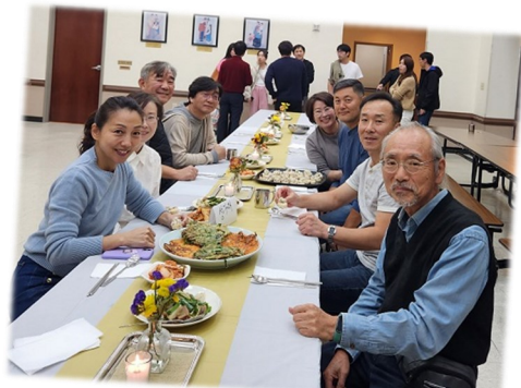
피에타 성가대 연습 및 점심 식사