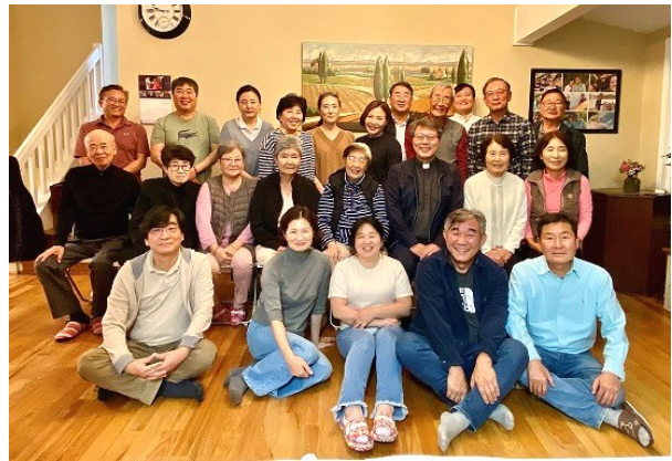
맥커밍 구역 미사