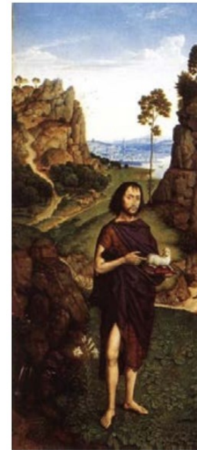
〈어린양을 가리키는 세례자 요한〉, 디리크 보우즈, 1470년경

도시에서 멀리 떨어진 외딴 곳에서 세례자 요한은 성경 위에 앉아 있는 어린양을 가리키며 서 있다. 이것은 말씀이신 예수님께서 이 세상을 구원하시기 위해 당신 자신을 희생 제물로 바치신다는 것을 의미한다.