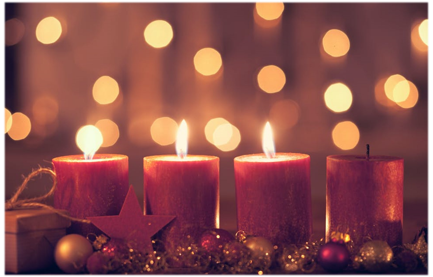
<대림초, 대림 3주>