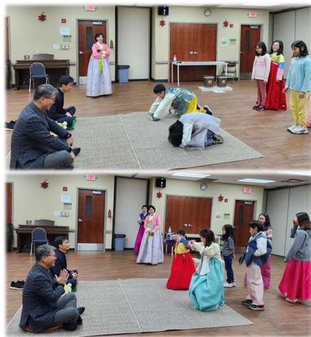
대건 한국학교 - 세배

성모회에서 설날을 맞아 맛있는 떡국을 만들어 주일 미사 후 신자들에게 나누어 주었습니다. 구역별로 모여 각종 신부님들께 세배를 드리는 시간이 있었습니다. 봉사해주신 성모회 분들과 구역 봉사자분들께 진