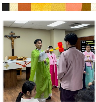
주일학교 - 설 미사