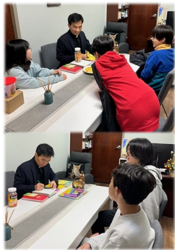
주일학교 부주임 신부님과 함께하는 세례공부