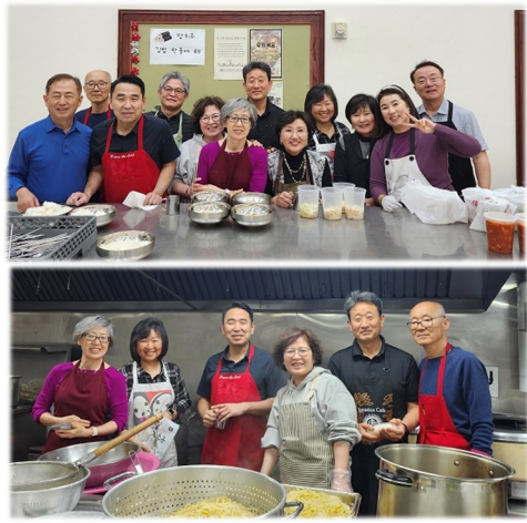
포사이스 구역 점심 봉사