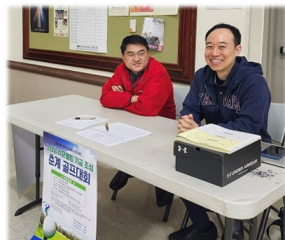
춘계 골프 대회 기금 모금