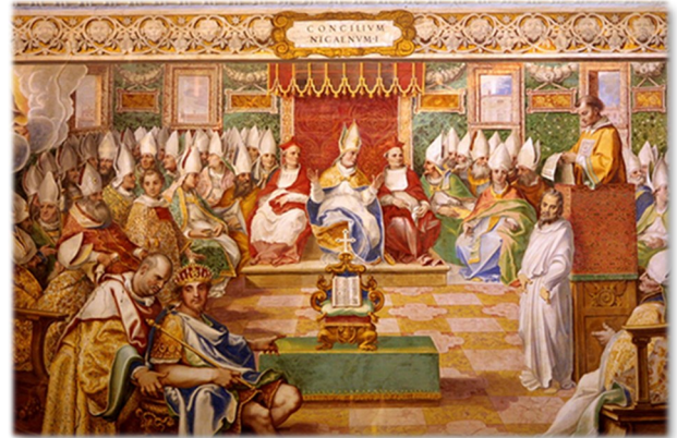
바티칸 시스티나경당의 프레스코화 '325년의 니케아공의회'. 「거룩한 부활절에 대한 거룩한 니케아공의회 교령」을 통해 춘분 뒤 보름달 다음 주일에 주님 부활 대축일을 지낼 수 있도록 정해졌다.

주님 성탄 대축일은 12월 25일입니다. 그럼 주님 부활 대축일은 몇 월 며칠일까요? 대충 4월쯤이었던 것 같은데 정확한 날은 잘 떠오르지 않습니다.