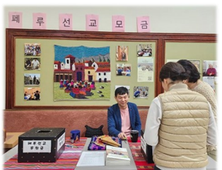
페루 선교 기금 모금