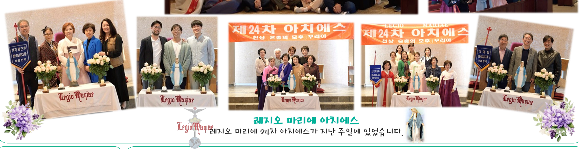
레지오 마리에 24차 아치에스가 지난 주일에 있었습니다.