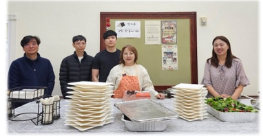
청년미사 후 식사봉사