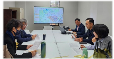
구역조정 위원회 회의