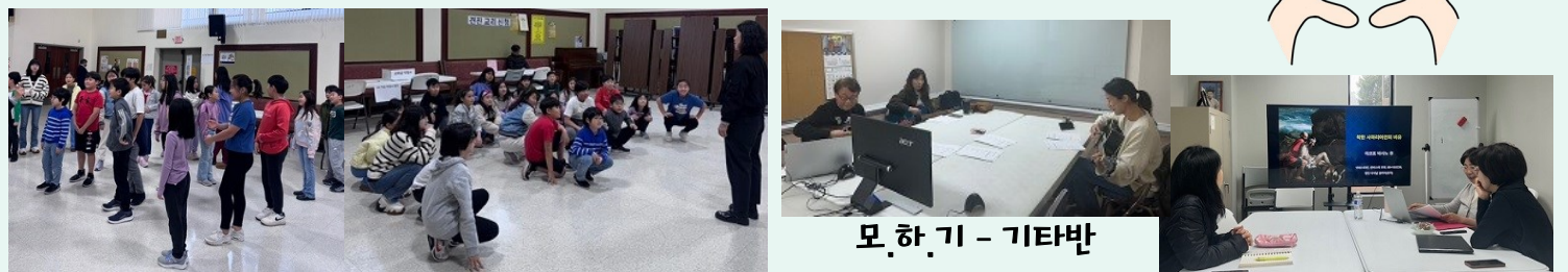
초등부 수업 - 액티비티