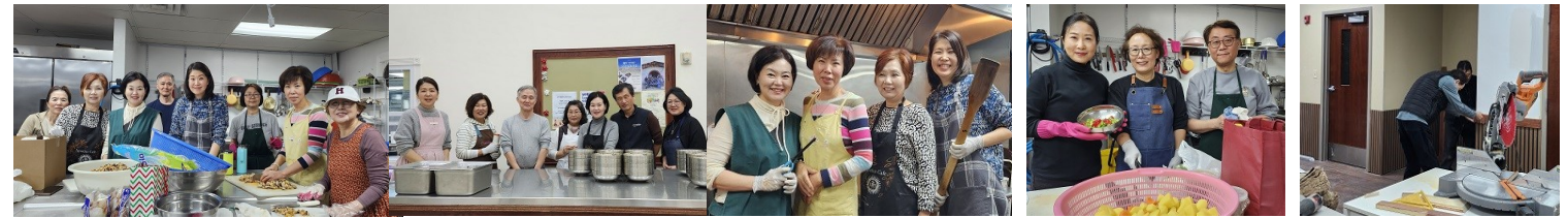
마리에타 1반&2반 점심 봉사 수고해주신 봉사자분들께 감사드립니다.