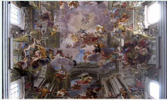
<그리스도의 승리> 안드레아 포초 일 제수 성당, 로마

작가는 예수회 회원으로서 자기의 예술적 자질을 통해 예수회의 모토 “모든 것을 하나님의 영광을 위하여”라는 목표에 도전하였으며 창설자인 로올라 성 이나시오의 삶을 그린 것임과 동시에 예수회의 활동을 잘 표현하고 있다. 예수회는 교황 바올로 3세에 의해 인가되었기에 이 작품은 예수회 탄생 2세기를 기념하는 작품으로써, 그동안의 예수회 활동을 소개하는 홍보적 성격을 띤 작품이다. 예수회 회원들은 종교 개혁으로 잃은 교회의 위상을 만회하기 위해 새로운 선교지를 개척했으며 이 작품의 네