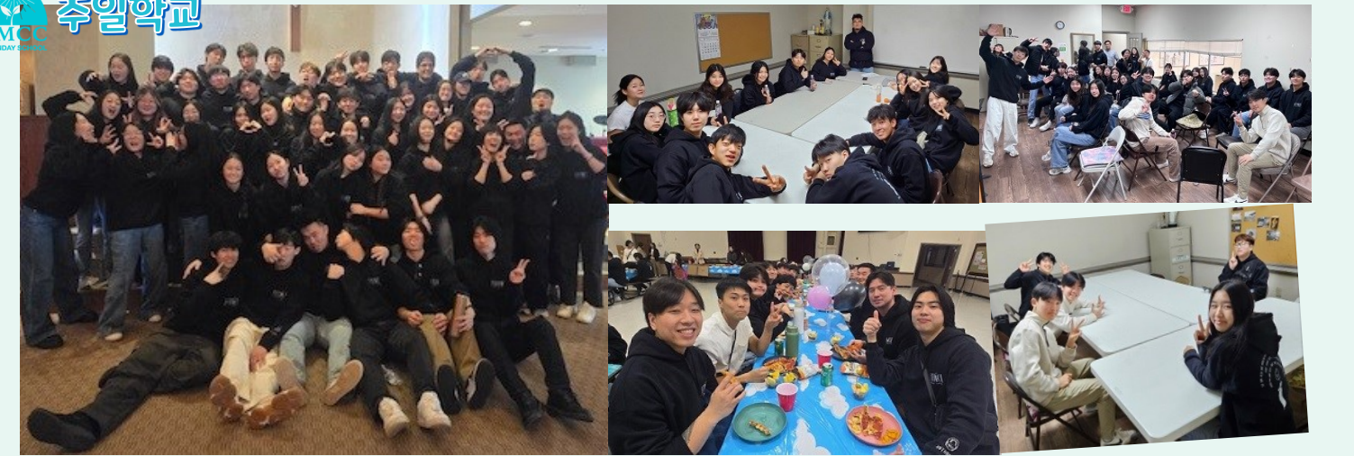
Youth Group 피정 후 Reunion 수업