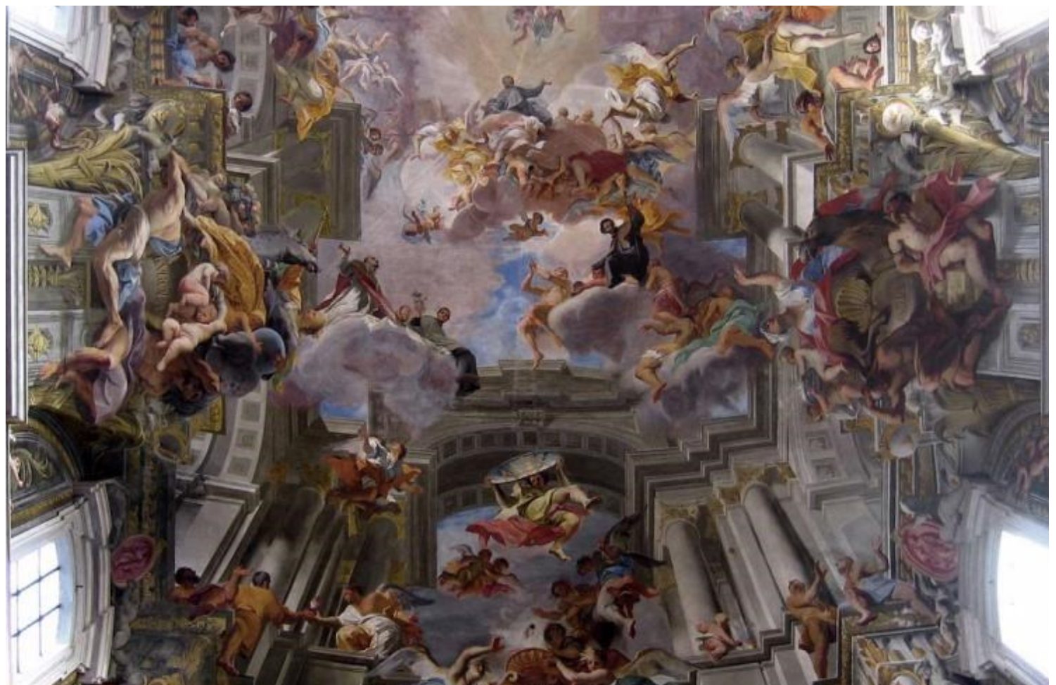
<그리스도의 승리> 안드레아 포초, 1674~79, 자코모 델라 포르타, 일 제수 성당, 1585, 로마