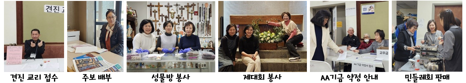
견진 교리 접수