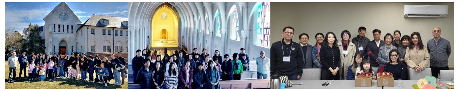
예비자 교리반 Monastery of the Holy Spirit 수도원 방문